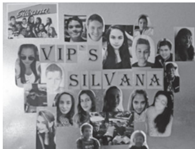
Unten: Einige VIP-Besucher des Silvana-Treffs. Bild: Nina Dummel