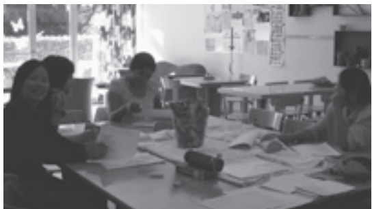
Mütter am runden Tisch

Acht Frauen sitzen am runden Tisch im Silvana (Quartiertreff: Hochstrasse). Drei haben ein kleines Kind auf den Knien. Wir singen zusammen ein Lied und machen die Bewegungen dazu. Es geht um rechts und links, ums Grüezi-Sagen, Winken und Klatschen.