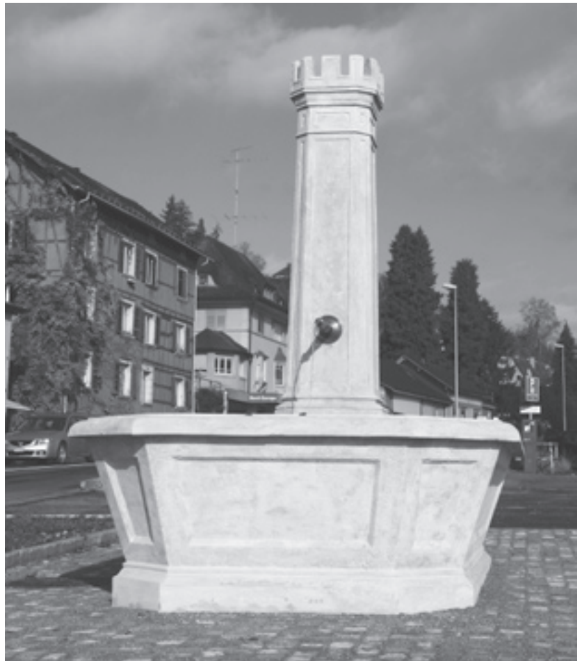
Brunnen beim Viehmarkt

Wir wünschen Ihnen schöne und besinnliche Weihnachten und einen guten Rutsch ins Neue Jahr.