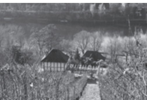
Das Bild zeigt den steilen Aufstieg vom Rhein auf den Rebberg