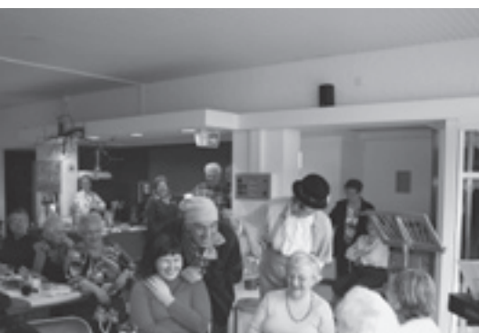
oben: Frühlingsfest der Seniorengruppe

Im Silvana treffen sich aktive Gruppen, die gerne die Räumlichkeiten nutzen. Von den BesucherInnen kommen viele positive Rückmeldungen zum Quartiertreff, der einladend, freundlich und doch funktional gestaltet ist. Das Silvana wird nach einem Jahr Bestehen von verschiedenen Menschen jeden Alters besucht. In der Quartierjugendarbeit gibt es personelle Veränderungen.