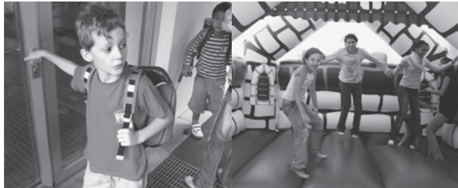
Schulanfang im Steingut Schulhaus

Im Anschluss finden Sie einige Angebote, die Kindern und Familien zugute kommen.