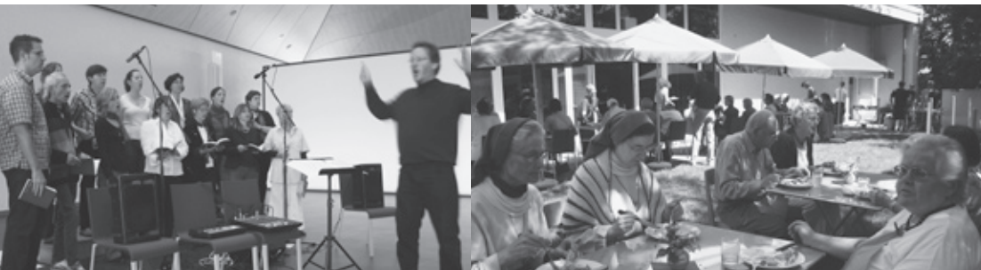
Gospelchor Rise up! begleitet Gottesdienst

Das war ein kleiner Ausschnitt aus dem, was in der Zwinglikirche so läuft... kommen Sie doch mal vorbei!