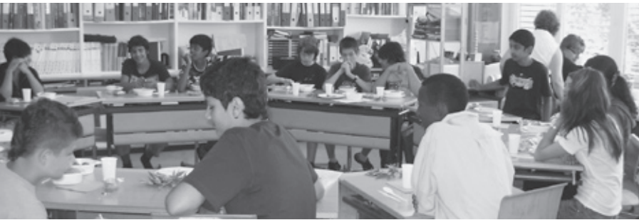
Abschiedsfeier 6. Klasse