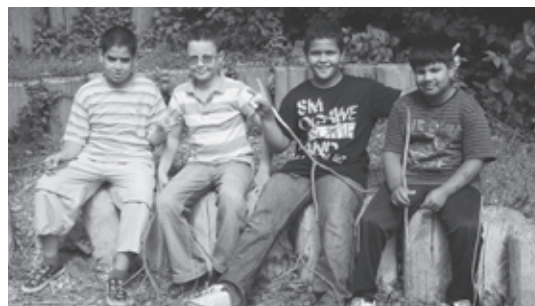
Kinder am bräteln

zu treffen. Ab Ende August sind die 12–16 jährigen Schülerinnen und Schüler bei uns im Silvana herzlich willkommen. Das Silvana ist ein Raumangebot, wo sich die Jugendlichen als Alternative zur Strasse oder Wirtschaft treffen können. Gleichzeitig ist der Treff auch ein Schonraum. Jugendliche in der Ablösung können im Treff Distanz zu Eltern und Lehrpersonen gewinnen. Der Treff wird alkohol- und drogenfrei geführt. Die Ideenfindung der verschiedenen Aktivitäten wird den Schülerinnen und Schülern überlassen. Bei der Umsetzung wird von der Schülertreffleitung Hand geboten und wo Hilfe nötig und möglich ist, werden sie von Katina Brouzos unterstützt.