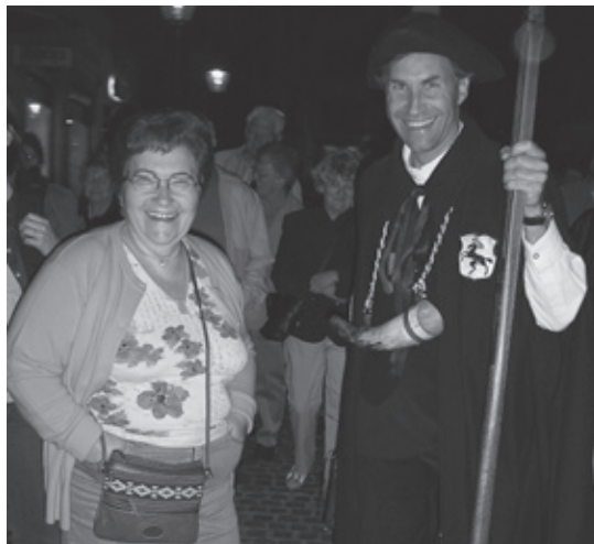
Unterwegs mit dem Nachtwächter

Wussten Sie übrigens, dass der Nachtopf früher am Morgen via Fenster entleert wurde, da der Fluss zum Abführen der Fäkalien durch die Stadt führte? Für die Frühaufsteher, welche bereits in der Stadt unterwegs