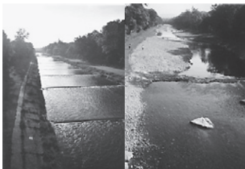
Gewässer vorher und nachher

Der Rheinaubund ist eine anerkannte, gesamtschweizerische Umweltorganisation. Seit bald 50 Jahren setzt er sich für den Erhalt und die Wiederherstellung natürlicher Lebensräume, den Schutz von Gewässern und Gewässerlandschaften ein.