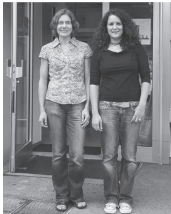
Die neue Crew im Quartierbüro Hochstrasse

Ich wünsche Ihnen eine angeregte Lektüre.