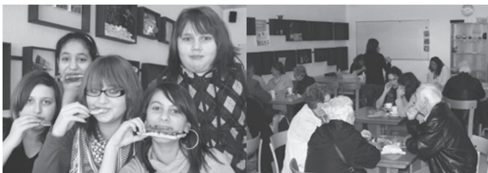
Pizzaschmaus im Silvana Tag der offenen Tür

Wir möchten noch darauf hinweisen, dass es im Silvana Platz für weitere aktive Gruppen hat. Nach wie vor befinden wir uns in der Aufbauphase. Neu haben wir auch Vermietungsverträge ausgearbeitet. Das Silvana kann für ruhigere, private Anlässe gemietet werden. Für Auskünfte und Beratung sind wir gerne für Sie da.