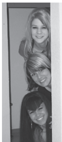
Team Hair-Finesse