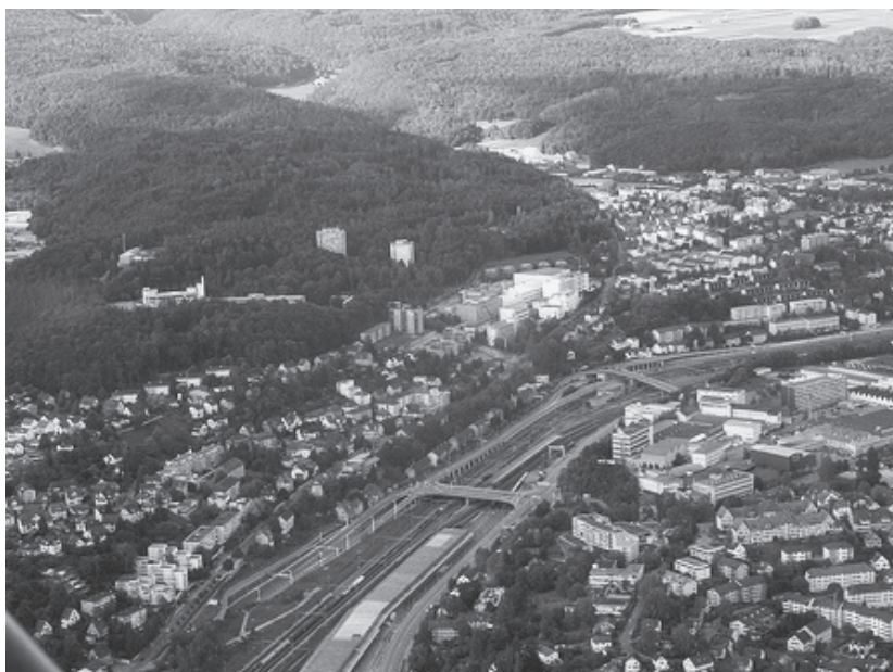
Flugaufnahme von unserem Quartier