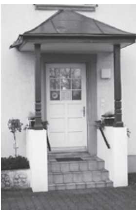
Eingang Hair-Finesse

Kundschaft. Augenbrauen und Wimpern färben gibt der Kundin eine ausdrucksvolle, intensive und individuelle Ausstrahlung. Auch Schminken, zum Beispiel für eine Hochzeit oder einen anderen grossen Anlass ist eine Dienstleistung des Teams von Hair-Finesse.