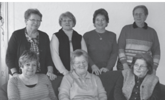
Teamfrauen vom Seniorentreff

Nun ist er da, der Seniorentreff im Quartier Hochstrasse/Geissberg! Dies ist eine Einrichtung für ältere Quartierbewohner und -bewohnerinnen zum geselligen Beisammensein. Die verschiedenen Anlässe und Aktivitäten werden kurzfristig bekannt gegeben mittels Flyer, Aushang oder in der Agenda des Wochen-Express.