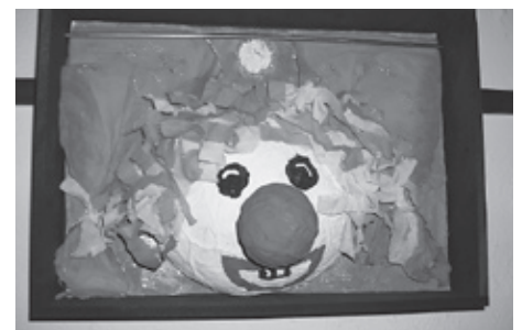
3. Platz: Sevde, Kisona und Yasemin