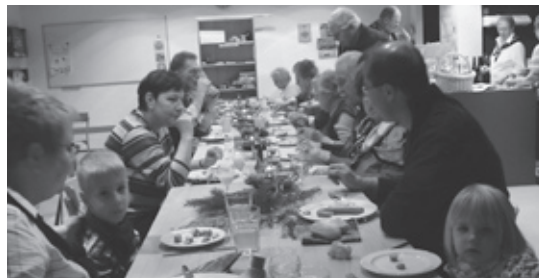
Weihnachtsfeier 08 im Silvana

Am 08. August 2008 wurde der Seniorentreff das erste Mal durchgeführt. Nur vier Frauen kamen zur Eröffnung. Niemand konnte sich damals vorstellen, dass sich die Besucherzahl in so kurzer Zeit vervielfachen würde. Am 08. November fand dann der Tag der offenen Tür mit grossem Erfolg statt. Auch die Weihnachtsfeier am 26. Dezember fand ein erfreuliches Echo. Den zahlreichen Besucherinnen und Besuchern wurde im weihnachtlich dekorierten Lokal ein vielfältiges Programm geboten. Es wurden Geschichten erzählt, und drei Schülerinnen vom Steingut-Schulhaus spielten und sangen Weihnachtslieder. Anschliessend gab es Kartoffelsalat und Wienerli, mit viel Liebe angerichtet von den organisierenden Frauen. Dies alles war mit viel Arbeit verbunden, sie wurde jedoch mit einer wunderschönen Feier belohnt.