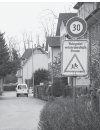
Mehr Sicherheit für den Langsamverkehr

Die rege Bautätigkeit auf dem Geissberg, sowie die Verlegung der Steuerverwaltung des Kantons Schaffhausen ins Hochhaus neben dem Spital hat in den letzten Jahren zu einer enormen Zunahme des Verkehrs im Geissbergquartier geführt. Weitere 33 Wohnungen sind auf dem Geisshofareal in Bau. Um die bisher hohe Wohnqualität in diesem Quartier zu erhalten, hat eine Gruppe von QuartierbewohnerInnen, unterstützt vom Quartierverein und der «Pro Velo», die Einführung von Tempo-30-Zonen im Geissbergquartier lanciert.