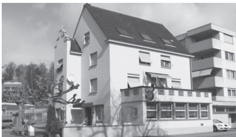
Ansicht von der Hochstrasse

Zum Znüni offeriert das Team seinen Gästen eine Auswahl an Sandwiches mit verschiedensten Fül-