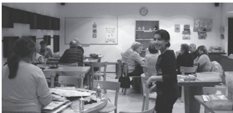
Begegnung zwischen SchülerInnen und SeniorInnen

Die im Jahr 2006 durchgeführte «Aktivierende Befragung» im Quartier ergab denn auch, dass es zahlreiche sichtbare oder latente Konflikte zwischen SchweizerInnen und MigrantInnen einerseits, zwischen Kindern/Jugendlichen und SeniorInnen andererseits gibt. Die Diskussionen drehten sich um fehlende Fussballplätze, darum, dass Kinder überall im Quartier weggeschickt werden, dass man nirgendwo etwas lauter sein darf, dass man sich auf der Strasse nicht mehr grüsst, dass sich das Quartier in den letzten Jahren so stark verändert hat und alle unter Strassenlärm und zunehmend fehlenden Einkaufsmöglichkeiten leiden.