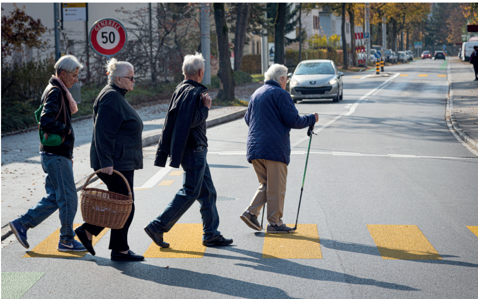
Impression von der Quartierbegehung 2016 beim Schulhaus Steingut.

bewertet werden. Danach sollen Mittel zur Umsetzung zur Verfügung gestellt werden.