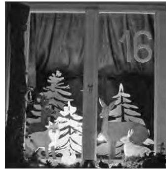
Bilder: Adventsfenster 2009