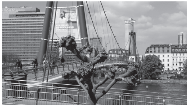
Velo- und Fussgängerbrücke in Frankfurt am Main

Der Duraduct bietet eine schnelle und sichere Verbindung für Fussgänger und Velofahrerinnen vom Geissberg auf die