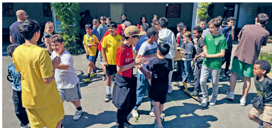
Hochbetrieb beim Tschütteli-Turnier