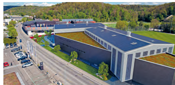
Visualisierung der projektierten Halle

3D Fotos von den neuen Hallen sind Visualisierungen und entsprechen nicht der Baueingabe.