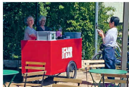
FahrBar im Fokus des Filmteams

Bereits vor 14 Uhr war auf dem Hartplatz ein reges Treiben festzustellen. Erstens war der Flohmarkt angesagt und die Verkaufsstände waren bald fertig eingerichtet, zweitens nutzten wir die Gelegenheit, der Quartierentwicklung zu ermöglichen, den aufgewerteten Hartplatz und die neue FahrBar in einer Foto- und Filmreportage festzuhalten. Sowohl die FahrBar als auch die Aufwertung des Hartplatzes konnten wir ja bekanntlich über das Quartierbudget finanzieren. Darum stellten wir uns gerne für einen Film der Quartierentwicklung zur Verfügung.