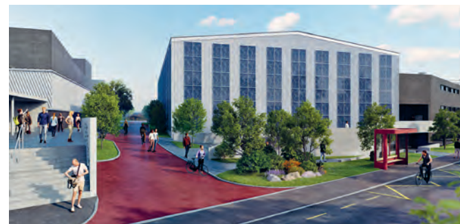
Visualisierung - Ansicht Schweizersbildstrasse