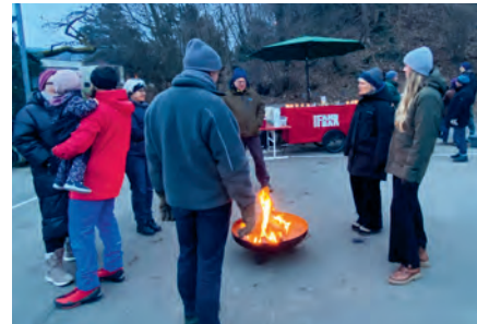
Wärmendes Feuer beim Neujahrsapéro