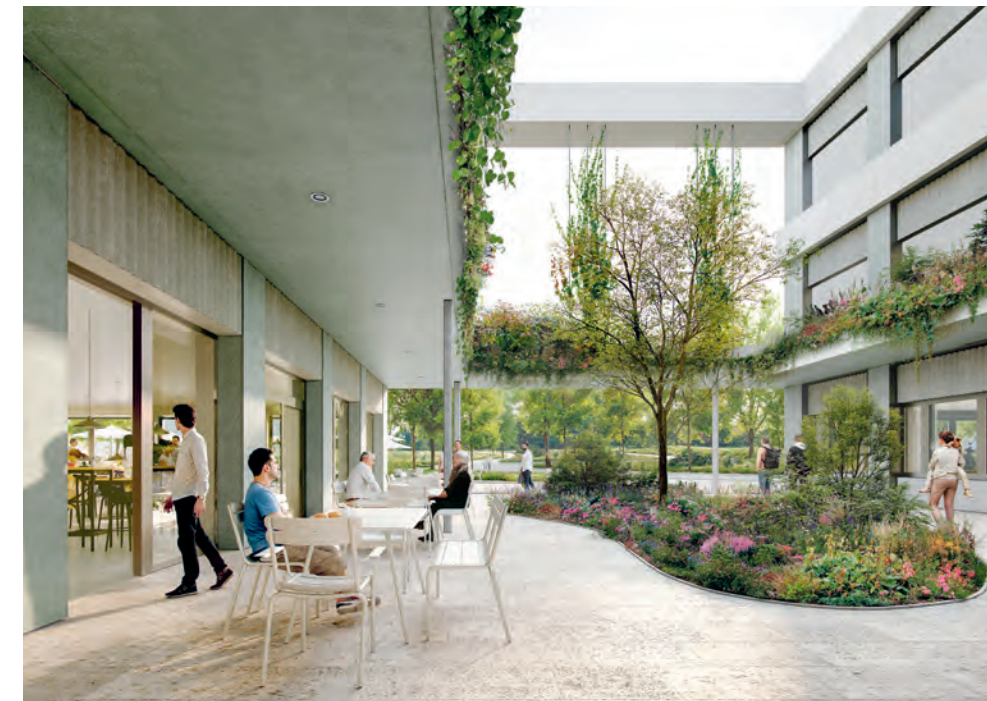
Geplanter Innenhof im Eingangsbereich

Andreas Gattiker betont, dass die Modernisierung des Kantonsspitals nicht zu einer Ausweitung des Angebotes führe. «Der Bau richtet sich am Leistungsauftrag des Kantons aus, ein Spital mit solider Grundversorgung zu betrei-