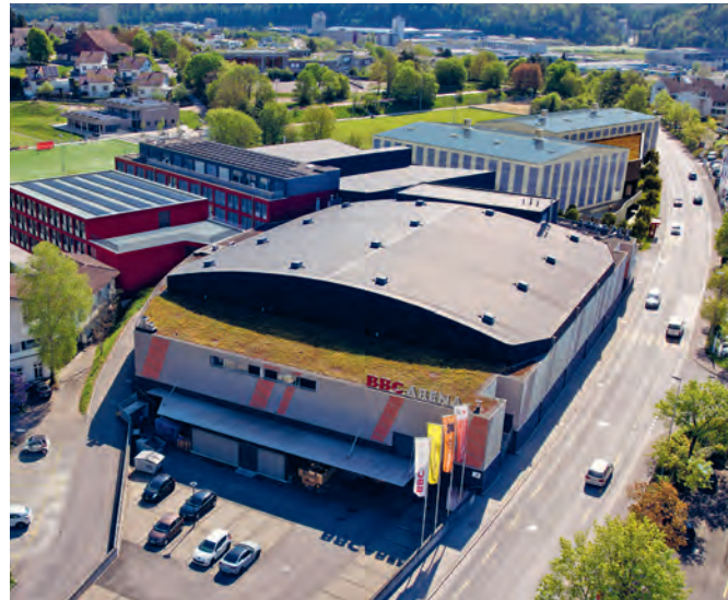
Visualisierung BBC-Areal – im Hintergrund die projektierten Gebäude